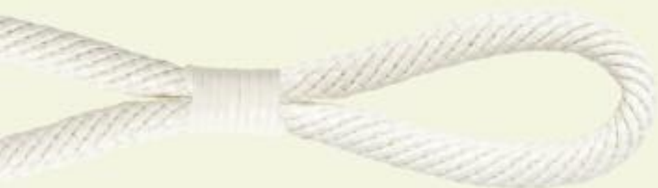
35042 / 9008