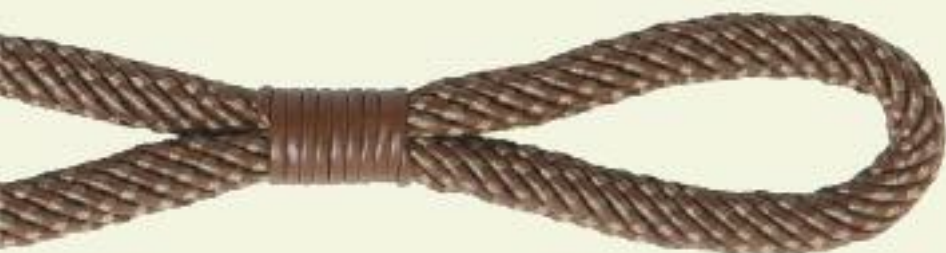
35042 / 9850