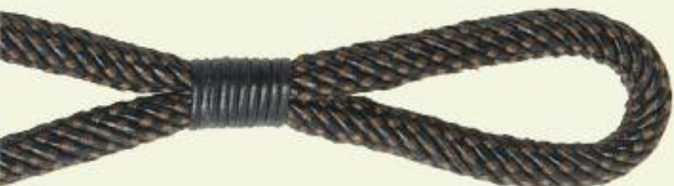
35042 / 9890